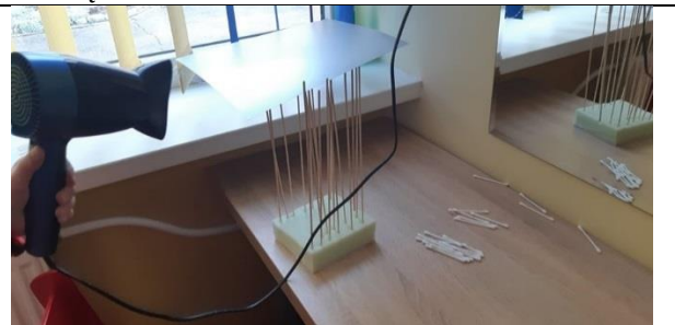
Ausų krapštukų namas subirėjo.