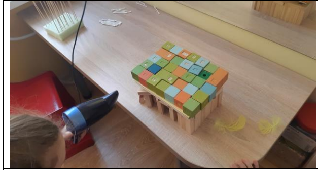
Namas atlaiko oro gūšį.