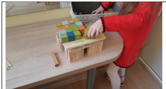
Namas iš kaladėlių.