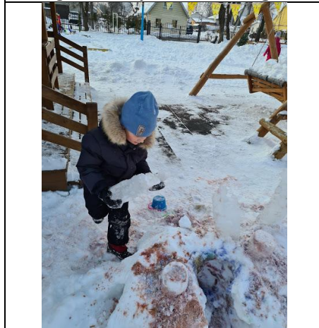
Ledo gabalai – statybinė medžiaga.