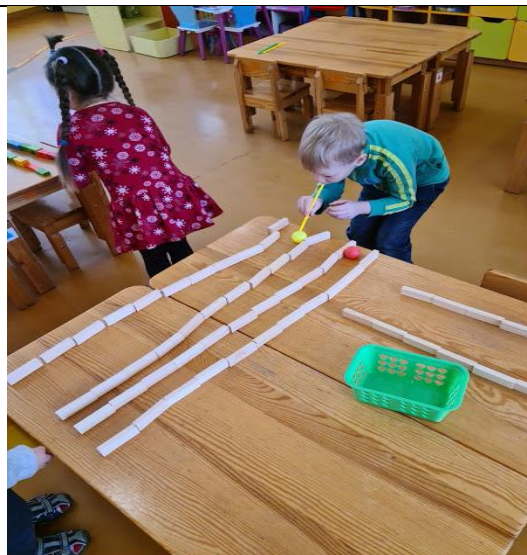
Saugus, tiesus takelis, kamuoliukui riedėti.