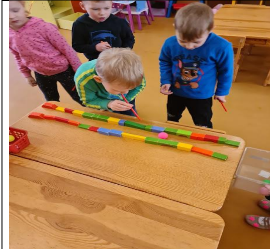
Kamuoliukas greitai rieda.