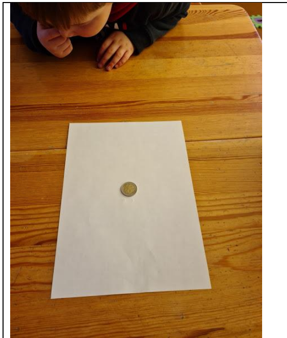
Vaikai stebi monetą.