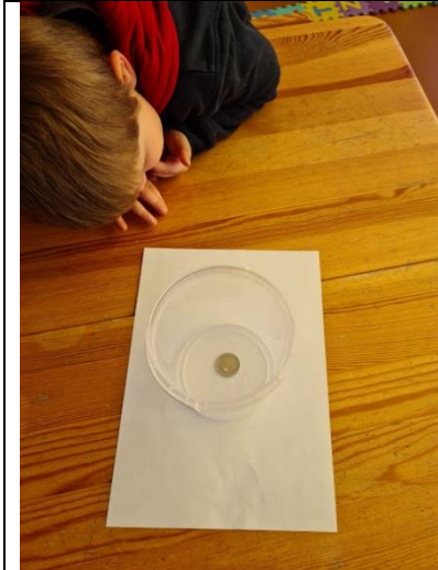
Moneta inde gerai matoma.