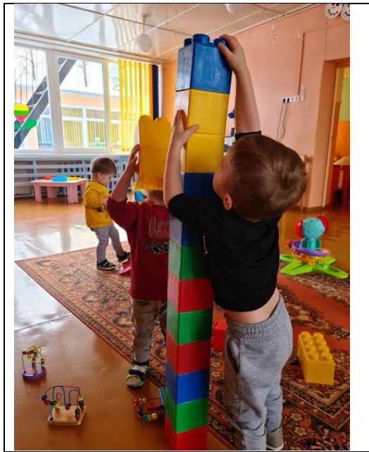
Bokštas pastatytas. Viršūnė nepasiekiamo.