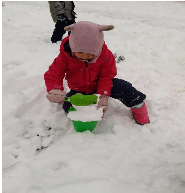
Sniego savybių tyrinėjimas.